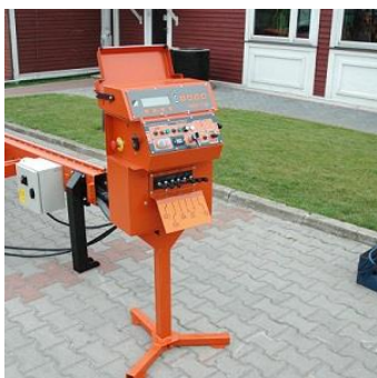
Дистанционный пульт управления