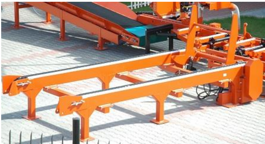
Приемный ленточный конвейер IC1-70