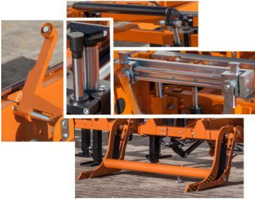
Конвейер поштучной загрузки бревна LD12/20